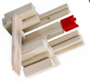
Kubb, bowlen, jeu de boules